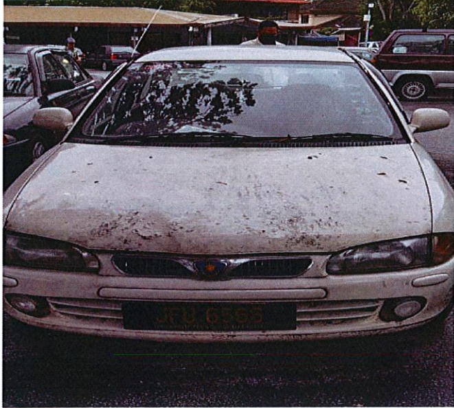
1. PROTON WIRA (JFU 6566)