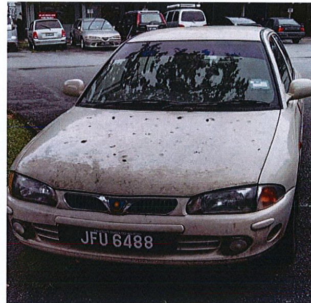
3. PROTON WIRA (JFU 6488)